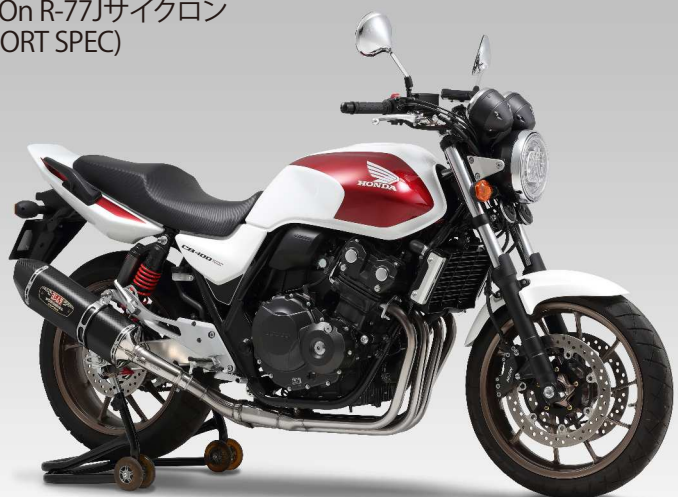
Slip-On R-77Jサイクロン (EXPORT SPEC)