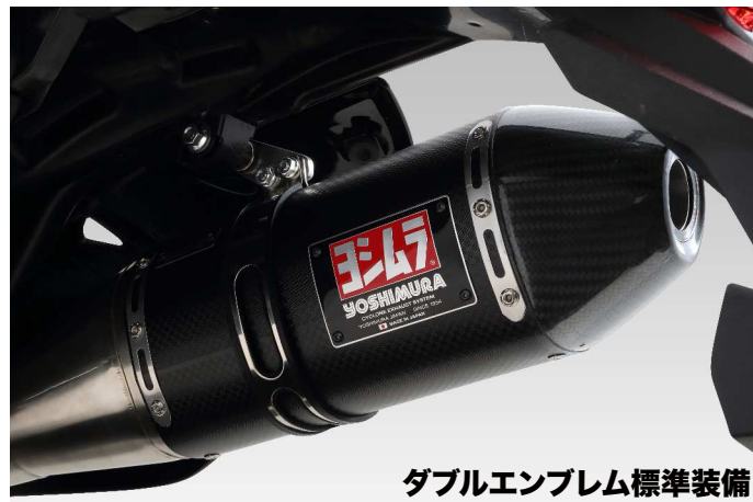
ダブルエンブレム標準装備