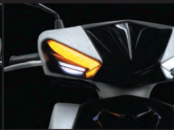
装着写真(ウインカー点灯時)