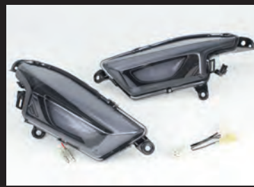
LEDフロントウインカーキット(スモークレンズ)