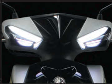
装着写真(常時点灯)