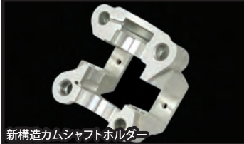
新構造カムシャフトホルダー