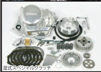
湿式スペシャルクラッチ