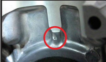
オイルジェット加工(124cc/130cc)