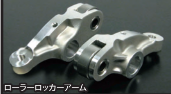
ローラーロッカーアーム