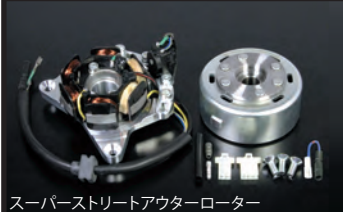
スーパーストリートアウターローター