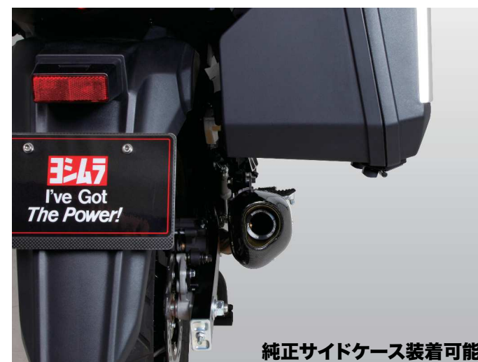
純正サイドケース装着可能