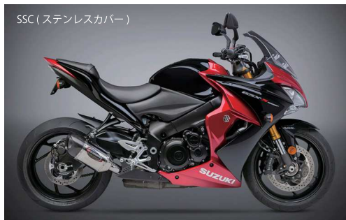
SCC (ステンレスカバー)