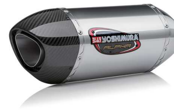
ステンレスカバー

軽量化を目的に、あらゆる分野において利用されている高強度の素材です。スポーティで硬質的な輝きを持つサイレンサーは上質な雰囲気演出しています。