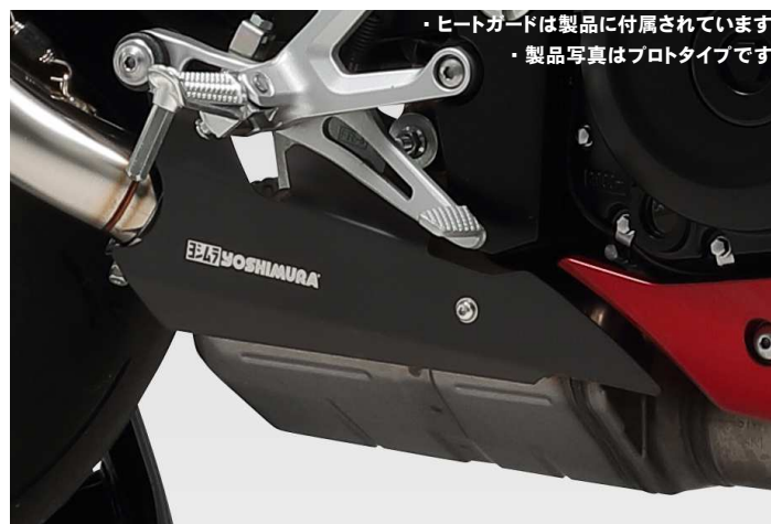
・ヒートガードは製品に付属されています。 ・製品写真はプロタイプです。