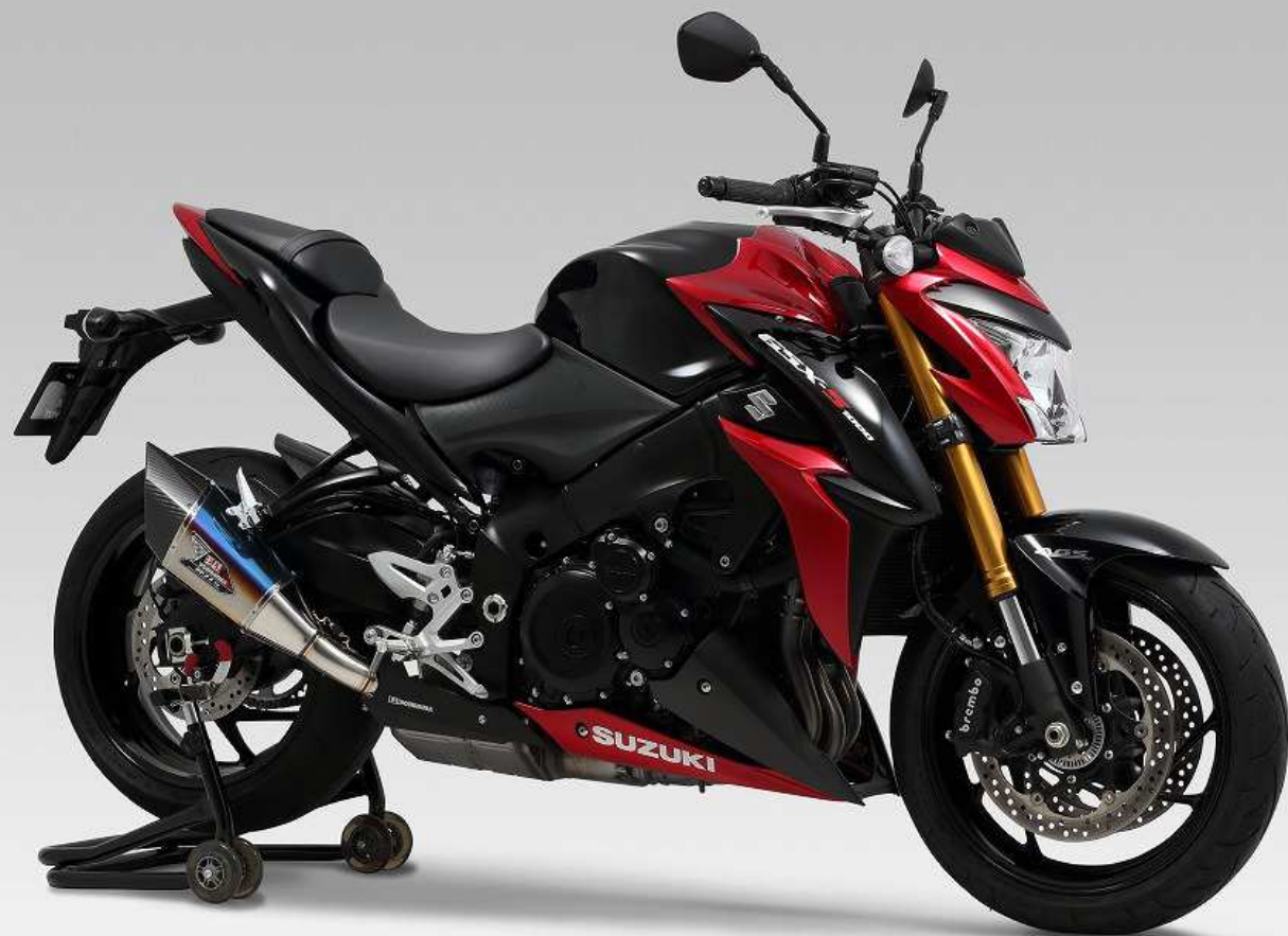
STB ・製品写真はプロタイプです。

GSX-S1000/F (15-17) Slip-On R-11Sqサイクロン EXPORT SPEC 政府認証 (ヒートガード付)