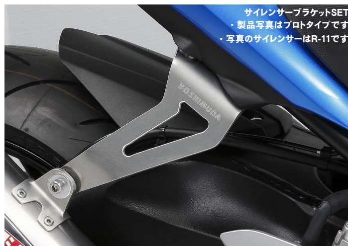
サイレンサーブラケットSET ・製品写真はプロタイプです。 ・写真のサイレンサーはR-11です。