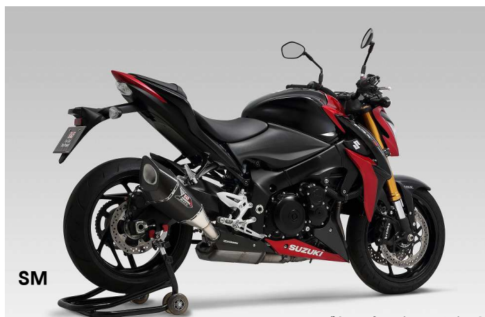
SM ・製品写真はプロタイプです。

ヨシムラサイクロン(レーシングサイクロンは除く)には、製品2年保証がついております。さらにリメイクサービス、マフラーホットライン等のアフターサービスにより、安心してヨシムラサイクロンをご利用いただけます。