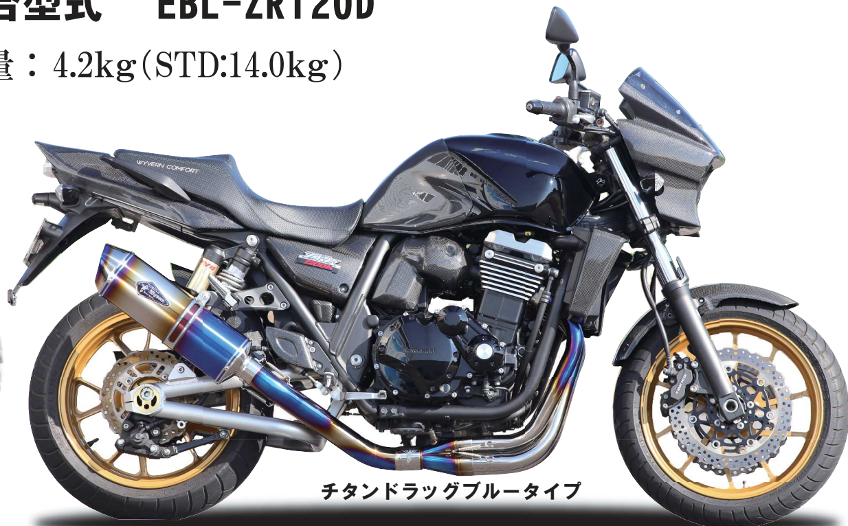
チタンドラグブルータイプ