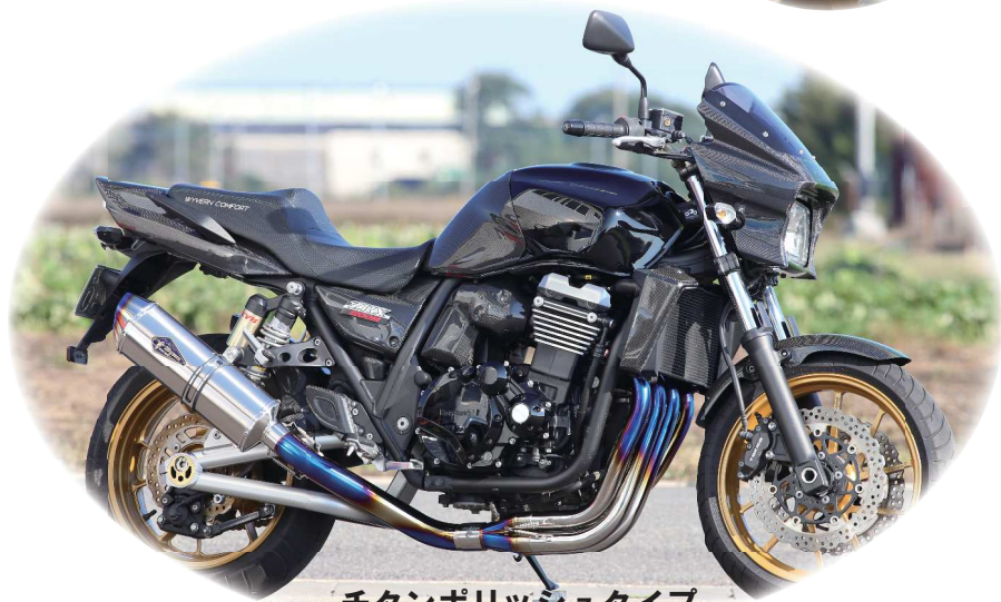
チタンポリッシュタイプ