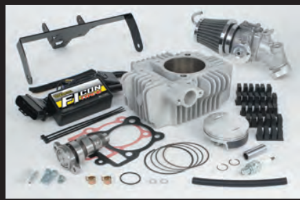
Hyper S-Stageボアアップキット178ccスカット (ビッグスロットルボディ仕様)