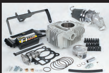
Hyper S-Stageボアアップキット138cc (ビッグスロットルボディ仕様)

又、ソフトやアプリのダウンロードが必要になる為、インターネットに接続されている必要があります。アプリの場合、有料となります。予めご了承下さい。