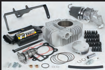
Hyper S-Stageボアアップキット178cc (N-20カム/ビッグスロットルボディー)