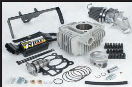
Hyper S-Stageボアアップキット138cc (N-20カム/ビッグスロットルボディー)

又、ソフトやアプリのダウンロードが必要になる為、インターネットに接続されている必要があります。アプリの場合、有料となります。予めご了承下さい。