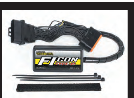
Hyper S-Stageボアアップキット付属 FIコン TYPE-e(インジェクションコントローラー)