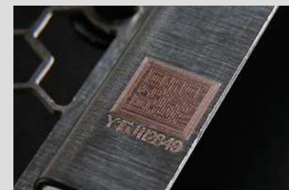
シリアル番号のイメージ