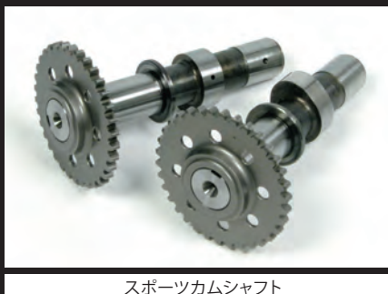
スポーツカムシャフト