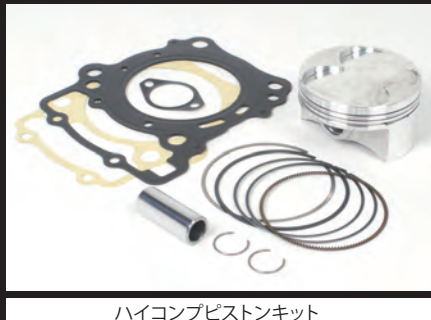
ハイコンピストンキット

※他社製の点火装置は点火電圧アップに伴う、放射ノイズの増大により誤作動や故障の原因となりますので同時装着しないで下さい。