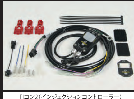
FIコン2(インジェクションコントローラー)