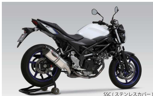
SSC (ステンレスカバー)

■ 性能特性「普段はクールに、攻めれば刺激的」—— 低中回転域の常用域性能を向上させながら、高回転域まで吹け上がる爽快なエンジンフィールを実現しています。