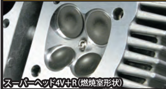
スーパーヘッド4V+R(燃焼室形状)

コンプリートエンジンは弊社メカニックが各パーツを適切な管理の上で組付け作業を行ったハイクオリティーエンジンです。