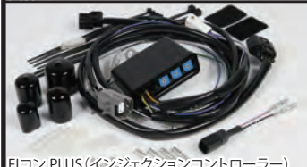
FIコン PLUS (インジェクションコントローラー)

モンキー(FI)用スーパーヘッド4V+R SCUT148ccコンプリートエンジンに合わせて、専用インジェクションコントローラー"FIコン PLUS"を自社内で開発しました。高性能シリンダーヘッドと大排気量のエンジンパックを最大限に引出す事が出来ます。 FIコン PLUSは内部に3次元燃料マップを持っており、各種センサーからの信号を元に高速演算を行い、エンジン状況に合わせて最適な燃料噴射を行う事が出来ます。又、燃料噴射回路だけでなく点火系回路も内蔵し、点火タイミングもコンプリートエンジンに合わせて最適化されています。 これらにより、ノーマルECUのレブリミットを超える高回転まで使用することが可能になります。基本マップはカムシャフト、マフラーの違いで設定されています。基本マップからの燃料補正やリミッターの回転数設定はFIコン PLUS本体のロータリースイッチをドライバーで回すだけで簡単に設定することが出来ます。