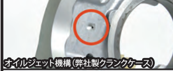
オイルジェット機構(弊社製クランクケース)

プライマリー式キックスターターは、ギアが何速に入っているにもかかわらずクラッチを切ることでエンジン始動が出来、再スタート時などに素早いエンジン始動が求められるレーシングユースにお薦めです。又、プライマリー式キックの場合、トランスミッションに直接負担をかけずエンジン始動が行えます。