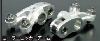
ローラーロッカーアーム

■スーパーヘッド4V+R(1カム4Vバルブ) 4Vバルブ化によりバルブカーテン面積を大きくし、吸排気効率を大幅に向上させています。 バルブ径 IN:21.5mm×2/EX:18.5mm×2 バルブステムシャフト径:IN/EX共に4.0mm オーダーシステムによりチタン合金製バルブスプリングリテーナー及びタペットアシヤスティングナットの選択が可能 最適なバルブ狭み角とヘッドのコンパクト化に伴い、M8スパークプラグを採用。 ローラーロッカーアーム:フリクションロスを低減させ低速回転から高速回転までスムーズにカムプロファイルを追従します。