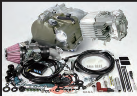
プライマリー式キックスターターシステムクランクケース 湿式スペシャルクラッチ (マグネシウムダイカスト製ブラウン塗装)

標準装備Sツ어링5速 :1速:2.357 2速:1.611 3速:1.190 4速:0.958 5速:0.807 スーパーストリート5速 :1速:2.357 2速:1.764 3速:1.400 4速:1.136 5速:1.000