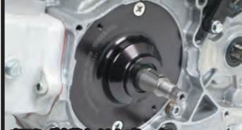
ベアリング内蔵オイルセパレーター

■排気量は148cc(148ccのスカット構造は特許を取得) ■セラミックメッキシリンダー&ピストン 耐久性、気密性、放熱性に優れたオールアルミ製セラミックメッキシリンダーを採用。 ピストン:ピストンスカート部には初期馴染みを良好にする為、モリブデンコートが施されています。