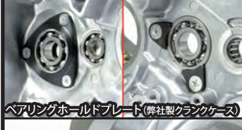
ベアリングホールドプレート(弊社製クランクケース)

■ベアリング内蔵オイルセパレーター オイルセパレーターにベアリングを内蔵することで、クランクシャフト軸を合計3点のベアリングで支持します。 フライホイールの重量による揺れや振動を低減し、エンジン性能を引出します。特に大排気量エンジンの高回転域にて高い効果を発揮します。