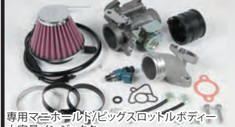
専用マニホールド/ビッグスロットルボディ-大容量インジェクター

TAF5速クロスミッションは高い耐久性と優れた作動性を兼ねており、S'ツリングとスーパーストリート2種類のギア比が設定されています。 コンプリート標準装備はS'ツリング5速になります。オーダーシステムにより、スーパーストリート5速クロスミッションを指定出来ます。