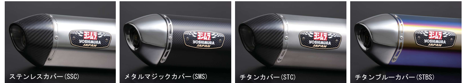
ステンレスカバー (SSC)